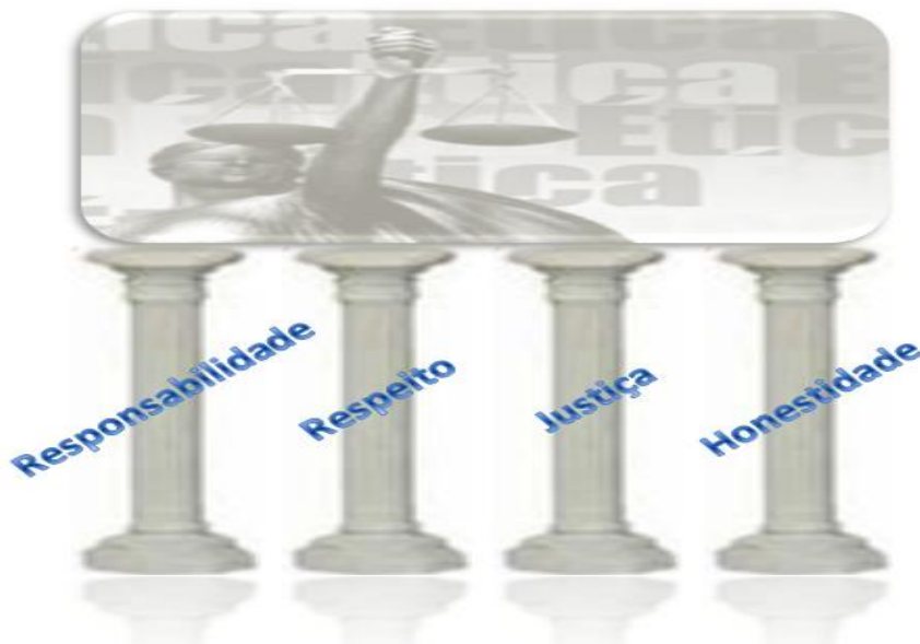
Figura 1 - Valores que fundamentam o Código de Ética e Conduta Profissional do PMI®

Os valores que fundamentam o Código de Conduta do PMI-RS são os mesmos que fundamentam o Código de Ética e Conduta Profissional do PMI® : Responsabilidade, Respeito, Justiça e Honestidade.