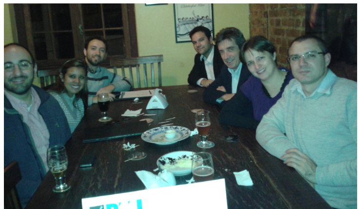
Happy Hour – Porto Alegre – 16/05