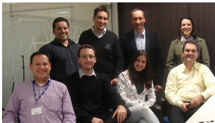
Voluntários do Ciclo de Palestras da Serra Gaúcha

Acesse o VRMS e verifique em que oportunidade você pode se envolver. Esteja certo: coisas boas acontecem quando você se junta ao PMI-RS!